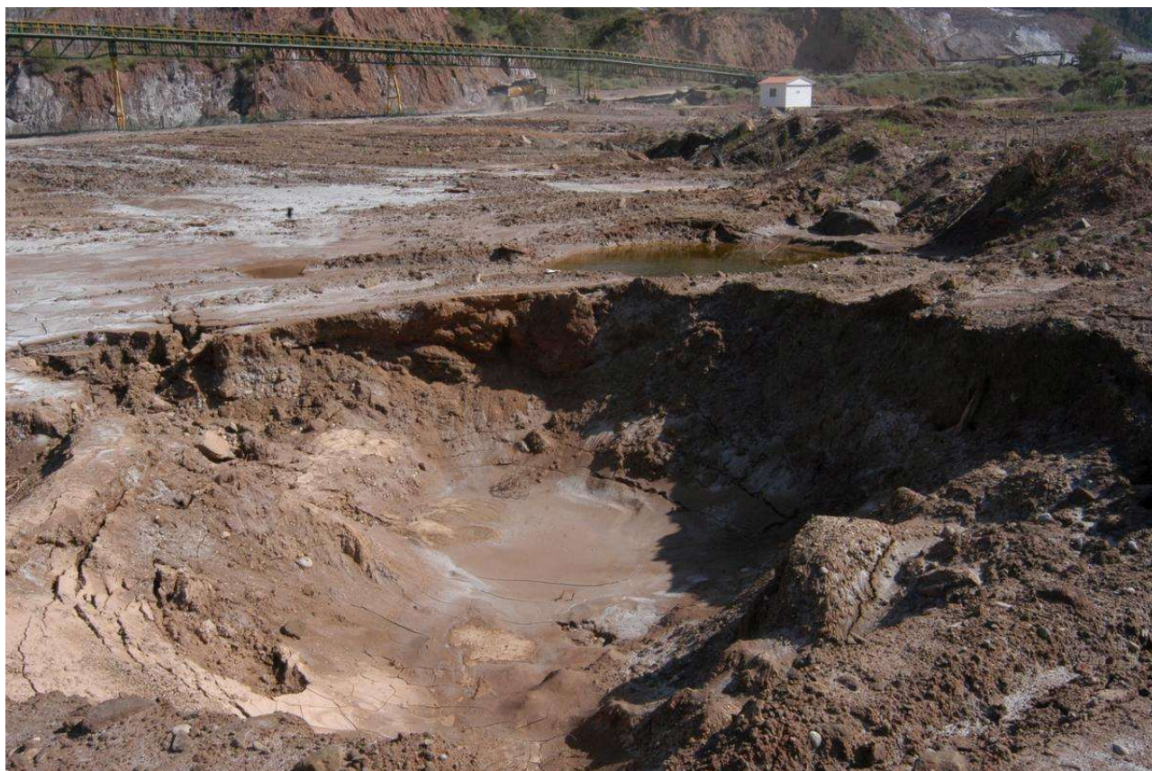
Bòfies (enfonsaments del subsol) a la Vall Salina, l'any 1990

Situem el context. Entre els anys 1998 i 1999 van aparèixer i proliferar les bòfies (enfonsaments del subsol que es manifesten en superfície) a la part baixa de la vall, tocant a la Coromina.