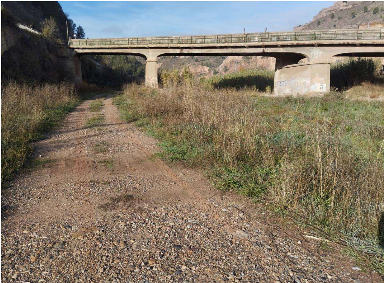
L'antiga llera per sota del pont de Santa Bàrbara

I en aquest sentit insisteix que «el 2026 nosaltres volem tenir l'estudi. Que es concreti què s'hi ha de fer per recuperar tant com sigui possible aquest espai del meandre. Podem entendre els motius pels quals es va prendre la decisió de desviar. Però són 25 anys que fa que la Coromina no té el seu riu i encara no tenim una imatge del que ha de ser per restituir l'espai».