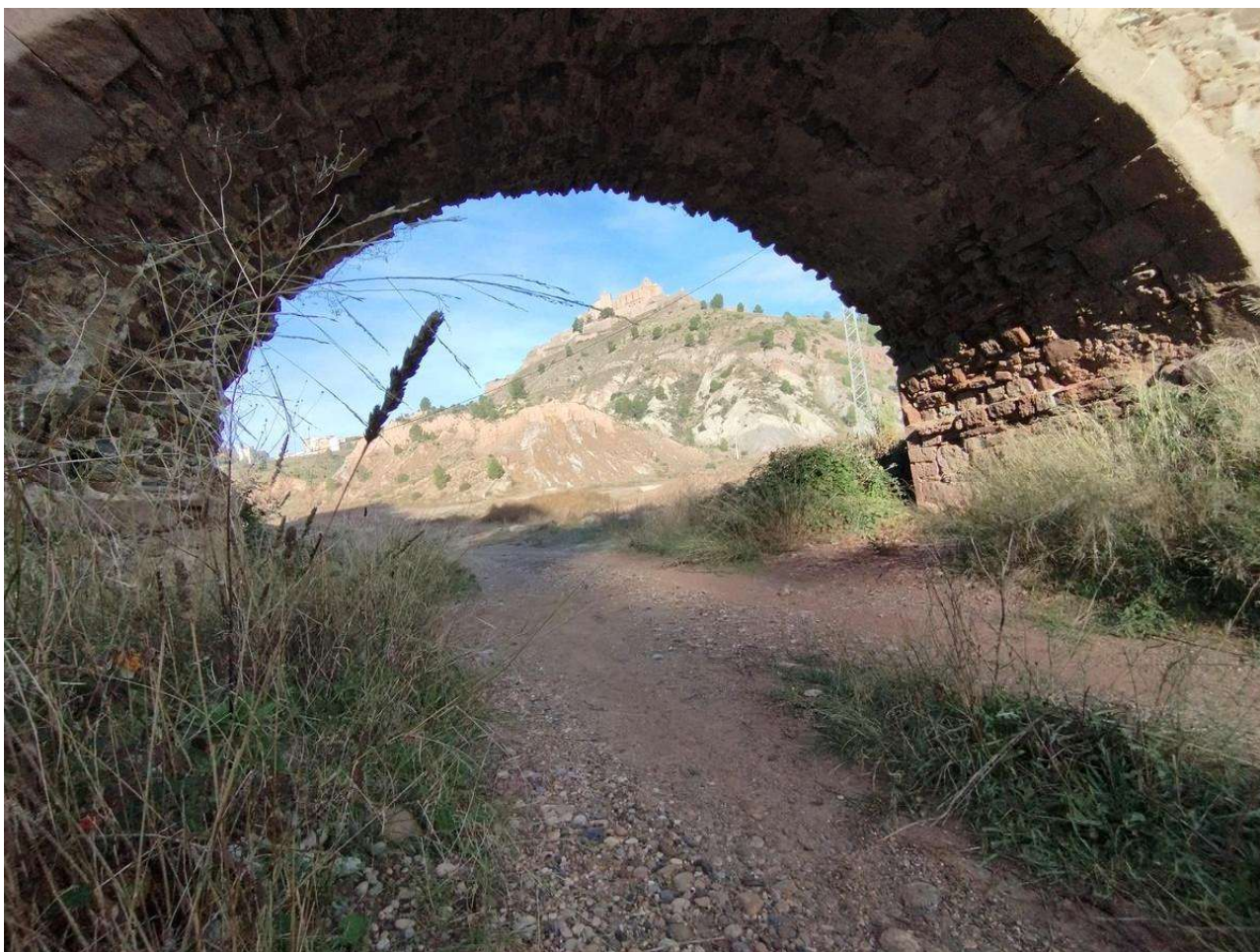
Tram de l'antiga llera, totalment seca, sota les arcades del pont de l'Aranyó