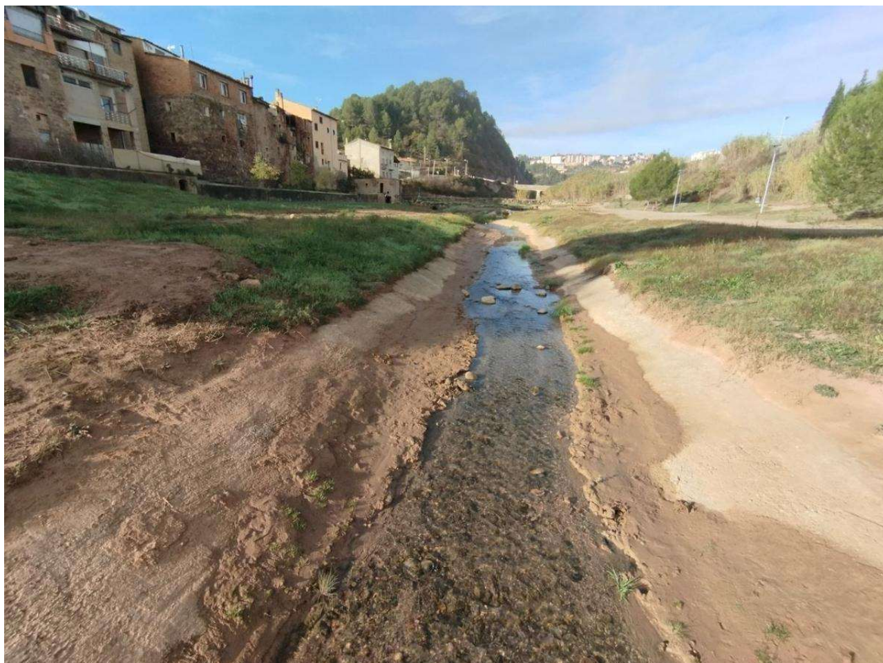
Tram de la Coromina per on es va tornar a fer passar artificialment una petita làmina d'aigua