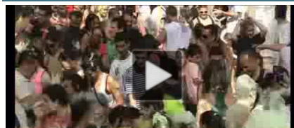
Festa Major Infantil de Sant Joan