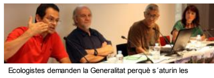
Ecologistes demanen la Generalitat perquè s'aturin les