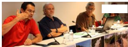
Ecologistes demanen la Generalitat perquè s'aturin les filtracions de les mines del Bages

Diverses entitats ecologistes han presentat davant de la Generalitat una demanda de responsabilitat ambiental perquè l'empresa Iberpotash aturi les filtracions salines de les mines del Bages i es faci càrrec de la reparació del paisatge i dels danys causats a la conca del Llobregat. Basant-se en una directiva europea, els ecologistes reclamen que la Generalitat faci els tràmits corresponents per fer complir la legislació ambiental, i que Iberpotash, filial de la israeliana ICL, es faci càrrec dels costos multimilionaris. A més, requereixen la suspensió temporalment del pla Phoenix, que preveu una gran inversió per duplicar l'extracció de potassa a Súria.