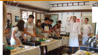
Campaments gastronòmics del Basque Culinary Center a Mura