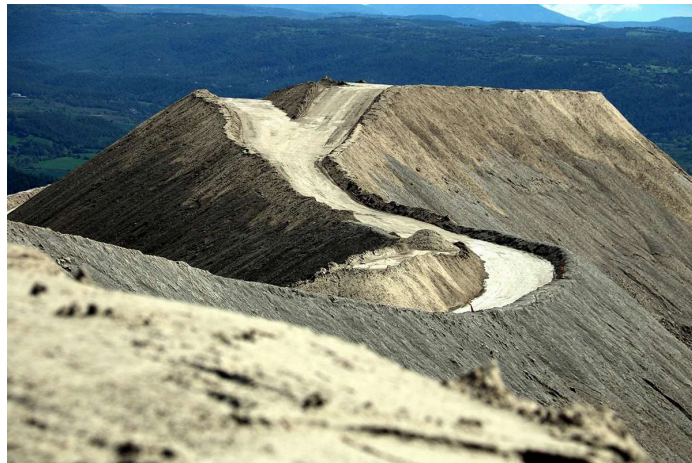
El runam salí del Cogulló des del cim | Nia Escolà / Arxiu