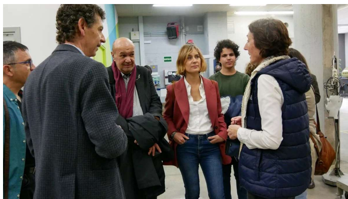
Imatge d'arxiu de la visita que diputats d'En Comú Podem van fer al CFP de Manresa el novembre