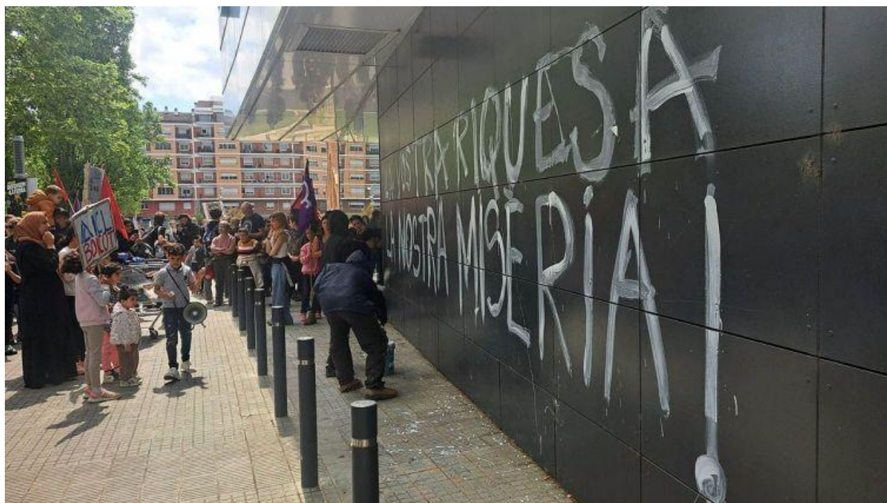
Pintada al Mercadona durant la manifestació del Primer de Maig

Aquests missatges i la necessitat d'autoorganitzar-se han estat presents durant tota la manifestació, que ha estat significativament llarga, de la plaça Catalunya fins a la Bona Vista , passant per carrer Barcelona, l'avinguda de les Bases de Manresa i la carretera de Santpedor. En el recorregut, els manifestants han fet diverses aturades per fer pintades als establiments per diversos motius.