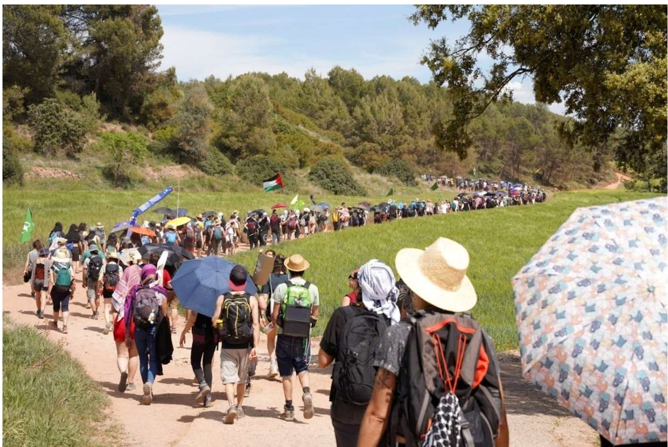
Columnes d'activistes de Revoltes de la Terra dirigint-se al runam salí