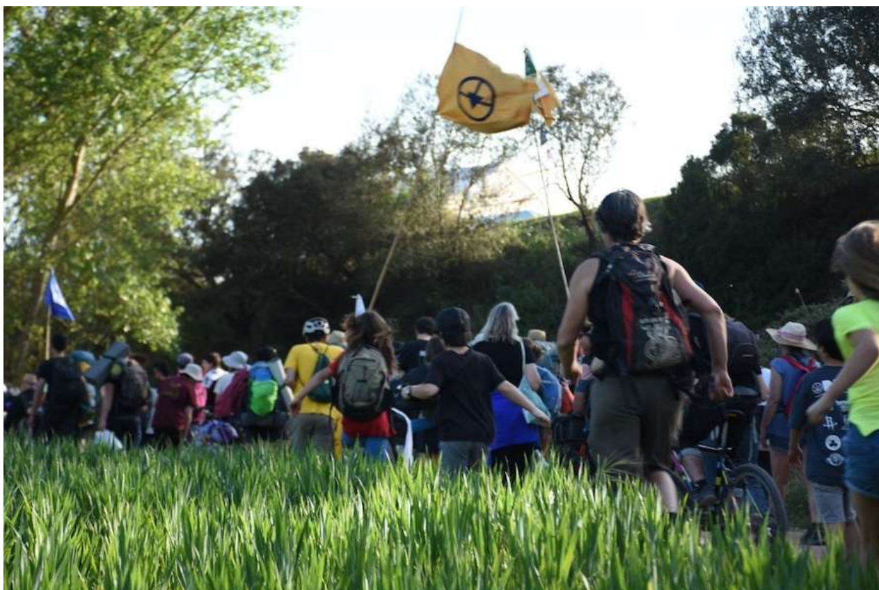
Columnes d'activistes dirgint-se al lloc on s'ubicarà l'acampada

L'objectiu final de la mobilització és “fer fora la multinacional ICL del territori” per aturar “l'enverinament del riu Llobregat” i posar fi a “la complicitat empresarial i política catalana amb el genocidi del poble palestí”. L'impacte mediambiental ja va ser reconegut el 2015 als tribunals. La sentència, que condemnava directius i la mateixa empresa, reconeixia que la gestió de les mines de Sallent havia provocat la salinització de rius, pous, fonts, torrents i aqüífers de tot el Bages. L'acumulació de residus salins derivats de la mineria també ha afectat la ramaderia i l'agricultura .