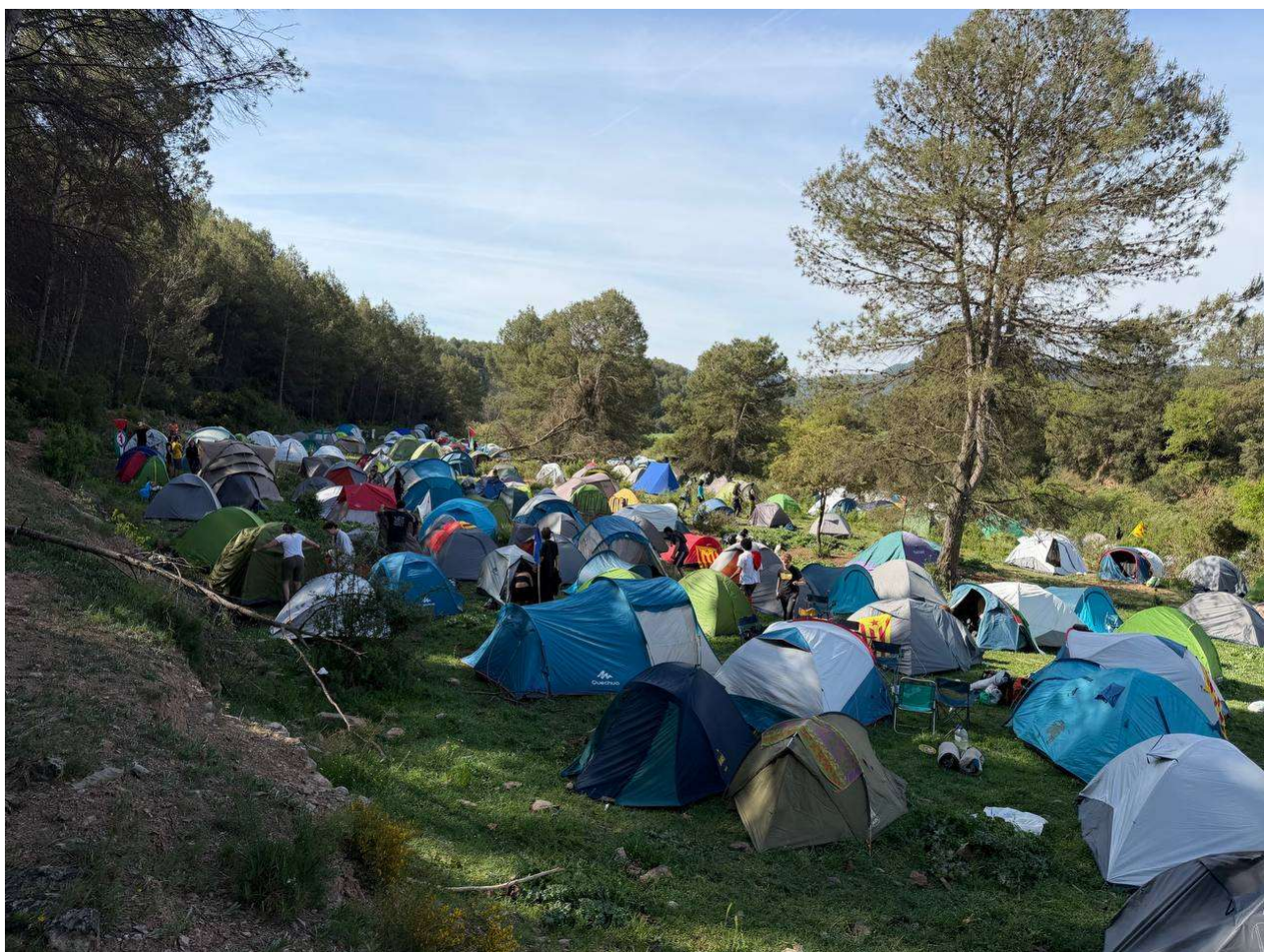
Acampada de Revoltes de la Terra | JESÚS RODRÍGUEZ