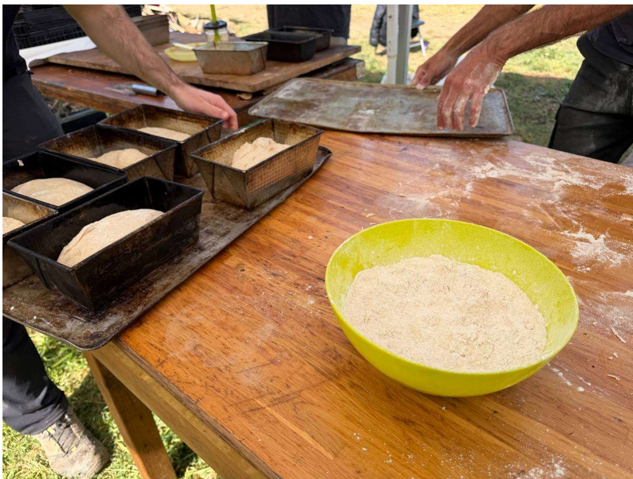
Comissió de cuina a l'acampada Revoltes de la Terra

La segona gran mobilització de Revoltes de la Terra arriba quan fa un any de l'acampada a Mont-roig del Camp contra els plans de construcció d'una fàbrica de bateries elèctriques de la firma Lotte. En aliança amb altres moviments de la comarca i organitzacions de solidaritat amb Palestina, volen denunciar l'impacte mediambiental de la seva activitat sobre els rius Llobregat i Cardener, així com pels seus vincles amb el genocidi del poble palestí.