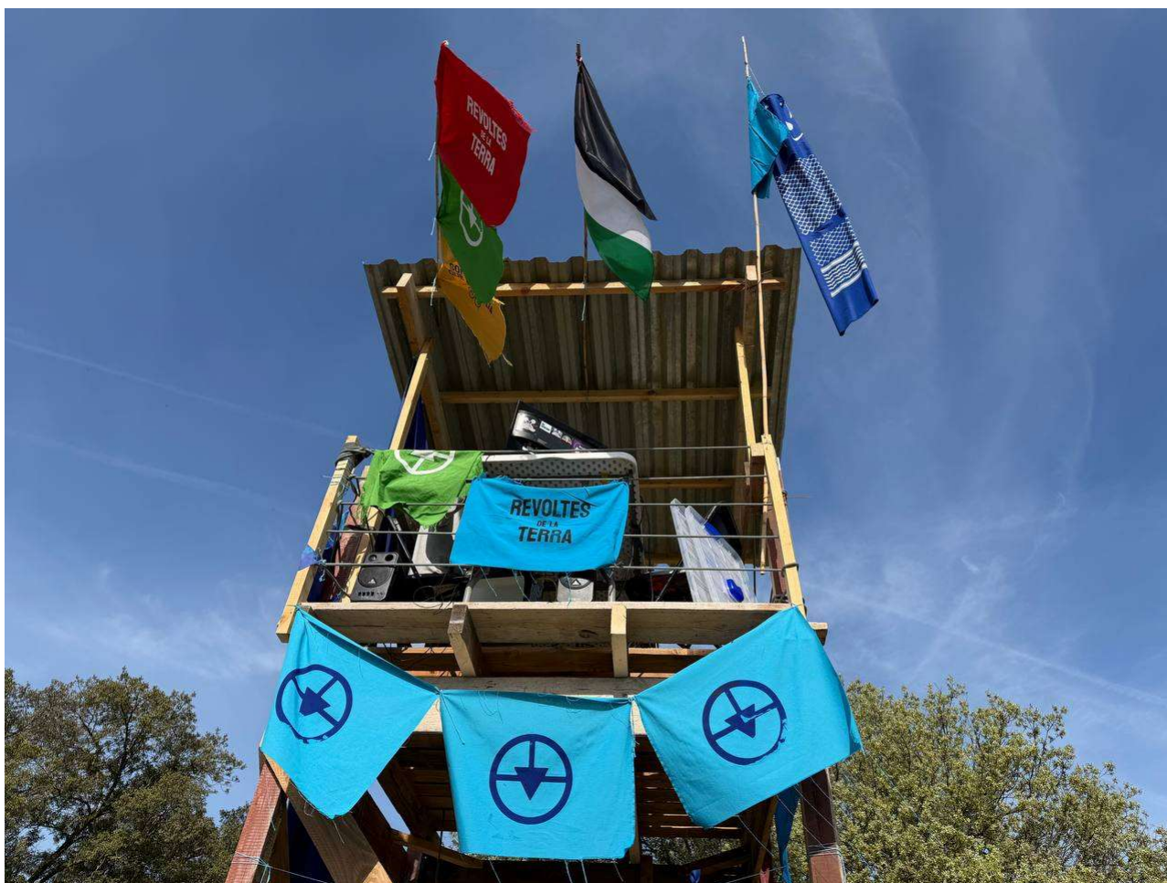
La torre de Ràdio Revoltes des d'on es retransmet el minut a minut de la protesta