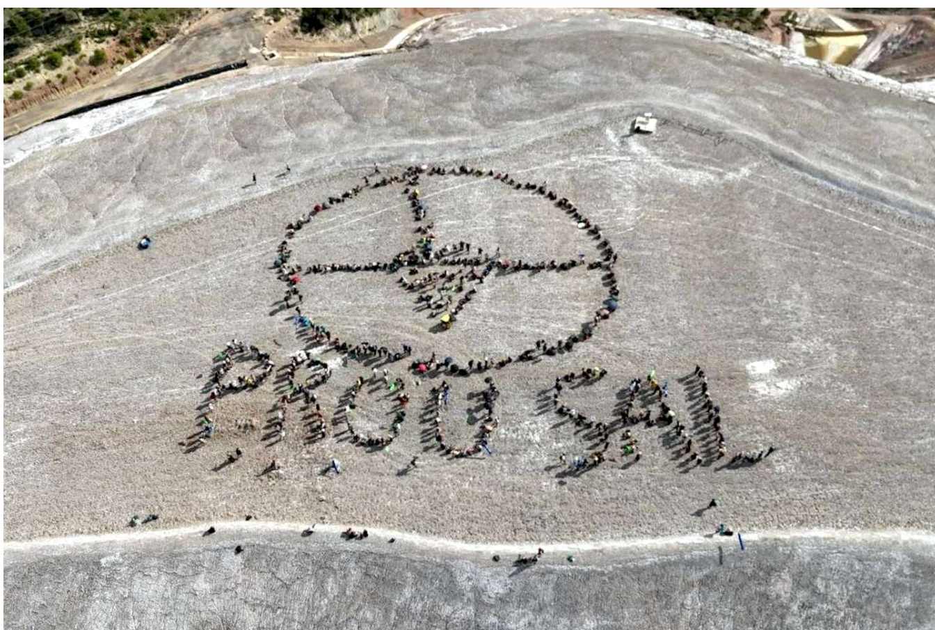
Mosaic a dalt la muntanya de salt de Sallent

Mentre centenars d'activistes han enfilat el runam salí del Cogulló de Sallent on han fet un mosaic amb el missatge "Prou Sal", un grup ha desmuntat les vies del tren que transporta material de la mina de Sùria al Port de Barcelona. Alhora, una altra columna ha tallat la c-16 i la c-25 en una marxa lenta que ha durat dues hores, per arribar finalment al barri de l'Estació de Sallent on s'ha fet un homenatge a les 800 veïnes desallotjades de casa seva el 2009.