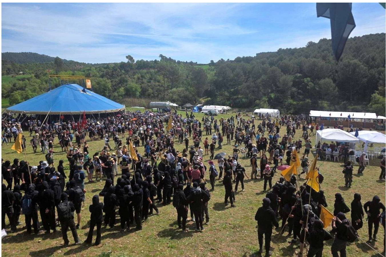
Acampada de Revoltes de la Terra