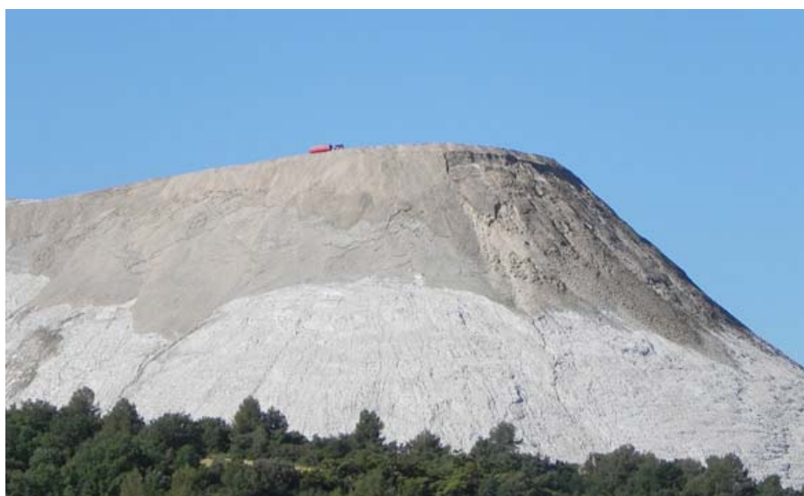
Escombrera salina del Cogulló en la localidad barcelonesa de Sallent

Tanto la Plataforma, como la Asociación de Vecinos de la Rampinya de Sallent, Prousal y propietarios de fincas afectadas por la salinización de aguas provocada por la actividad extractiva entienden que el PDU "es un instrumento inapropiado, tramposo y jurídicamente inviable" que pretende suplantar la legislación ambiental aplicable.